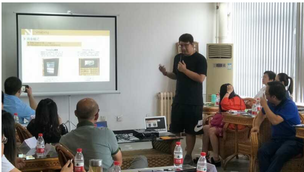
程英睿校友做主题分享