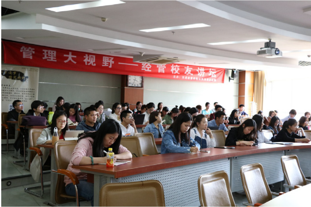
合影留念后，活动结束。