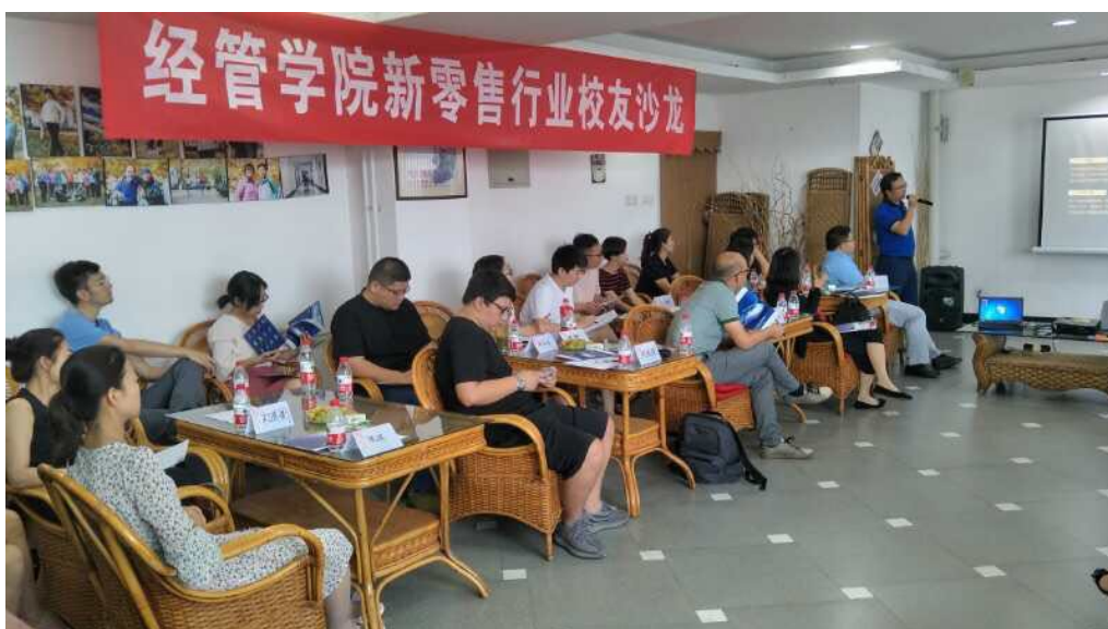
李洲校友做主题分享