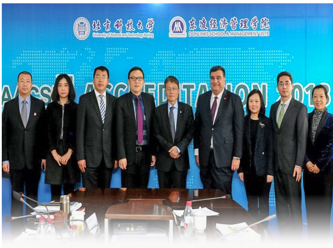
现场访视专家会见学院领导

通过 AACSB 认证，标志着学院国际化工作取得标志性成果和重大进展。学院将会进一步践行在管理和经济学界培养创新型人才和发展前沿知识，为相关行业和整个社会提供最好服务的使命，继续为打造具有行业特色的一流经济管理学院而努力奋斗。