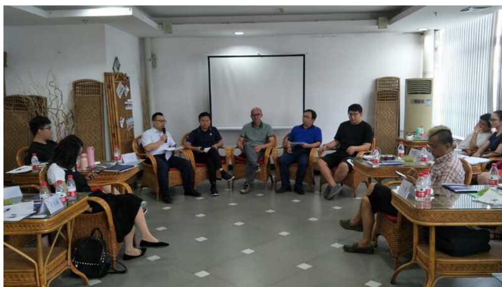
嘉宾与校友们面对面交流