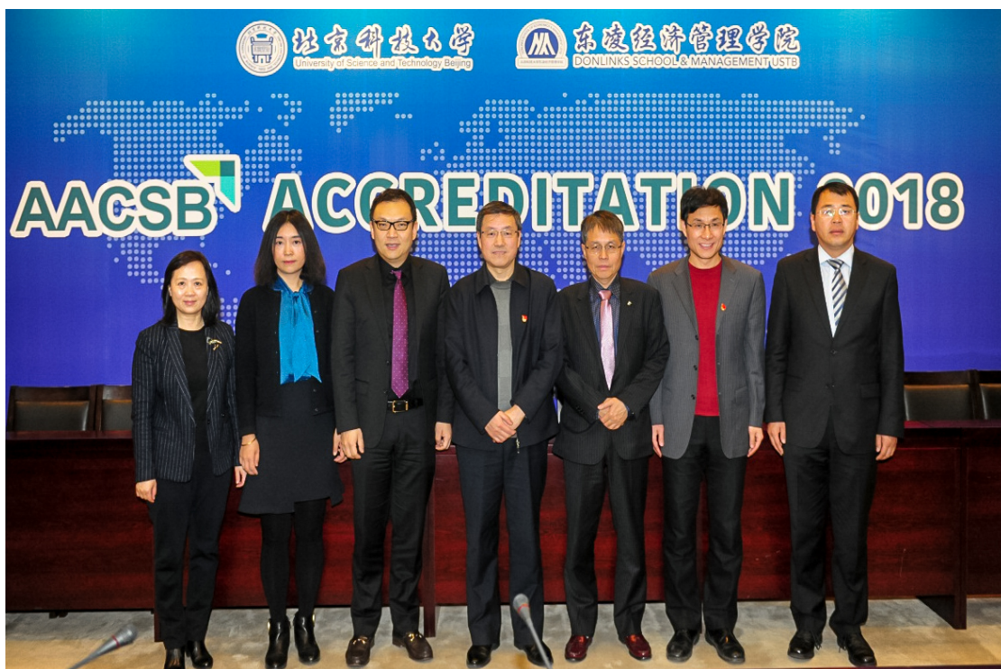
学校领导会见现场访视专家

北京科技大学东凌经济管理学院是继中国科技大学管理学院之后中国大陆地区第2家免提交进展报告阶段，直接进入现场认证阶段的学院。学院认证工作的顺利高效完成得益于学校领导的高度支持、全院师生、校友、雇主单位等的广泛积极支持与参与。