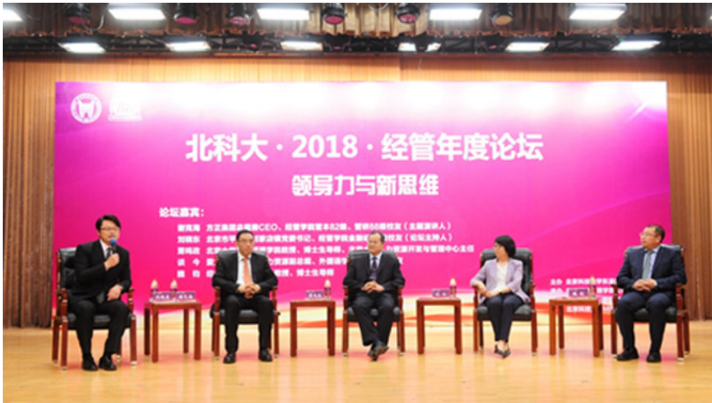
北科大·2018·经管年度论坛