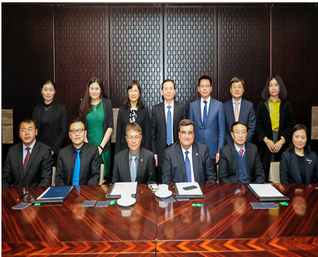
现场访视专家会见学院杰出校友

北京科技大学东凌经济管理学院是继中国科技大学管理学院之后中国大陆地区第2家免提交进展报告阶段，直接进入现场认证阶段的学院。学院认证工作的顺利高效完成得益于学校领导的高度支持、全院师生、校友、雇主单位等的广泛积极支持与参与。