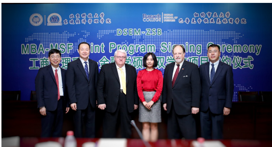
学院领导与纽约市立大学巴鲁克分校杰克林商学院领导合影

参加此双学位项目的学生第一年将在经管学院完成工商管理硕士的核心管理类课程，第二年在纽约完成金融学硕士课程。通过两年的国内外学习与实践，学生将同时掌握管理学与金融学，成为既懂国内企业管理现状，又熟悉国外资本市场环境的复合型高级管理人才。